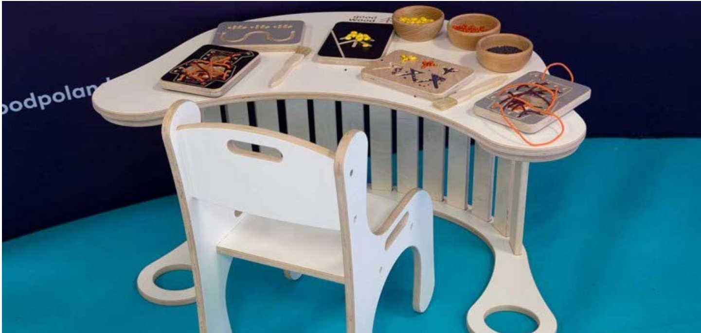
เฟอร์นิเจอร์และของตกแต่งสำหรับทารกและเด็ก