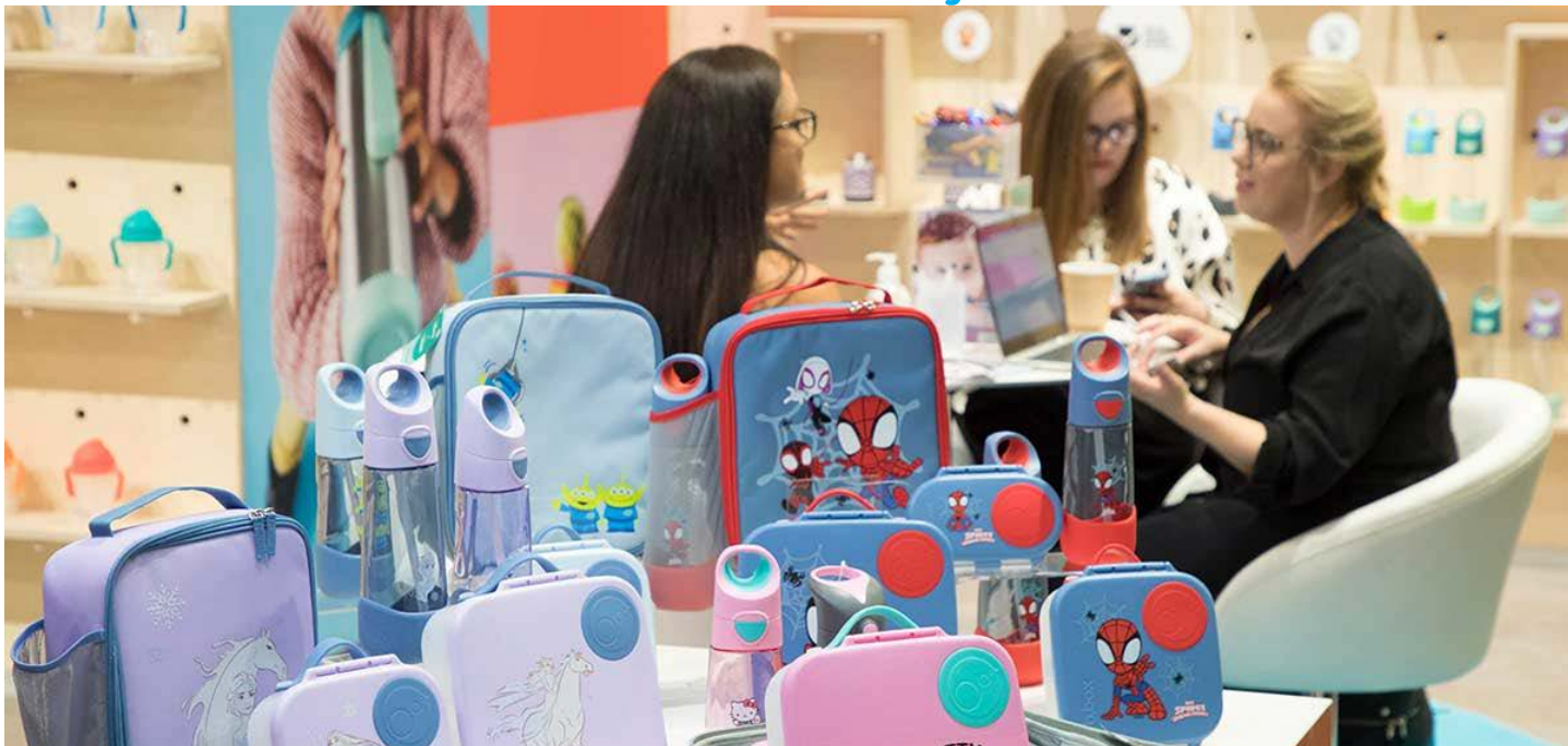
ผลิตภัณฑ์สำหรับการดูแลคุณแม่และเด็ก