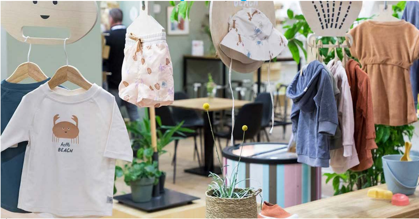
เสื้อผ้าและแฟชั่นสำหรับแม่และเด็ก