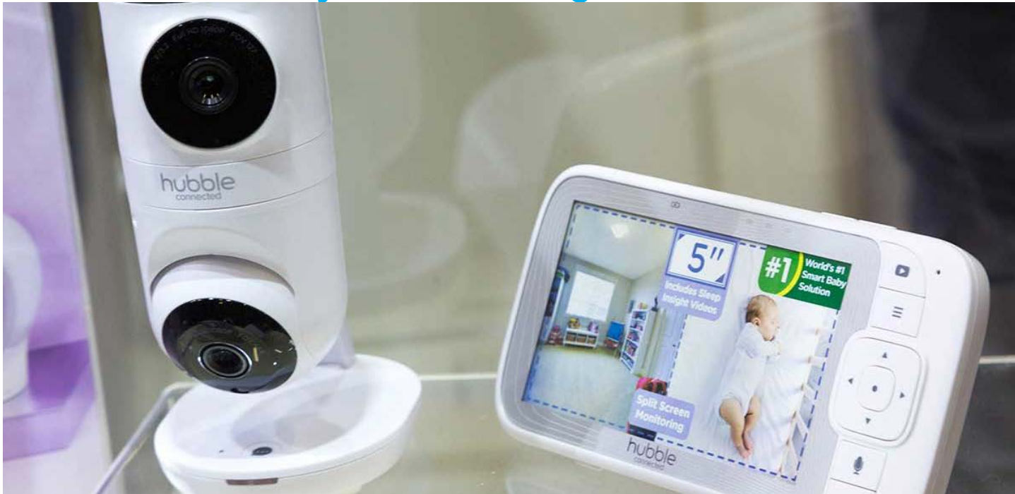
ผลิตภัณฑ์ด้านความปลอดภัยในบ้าน สำหรับทารกและเด็ก